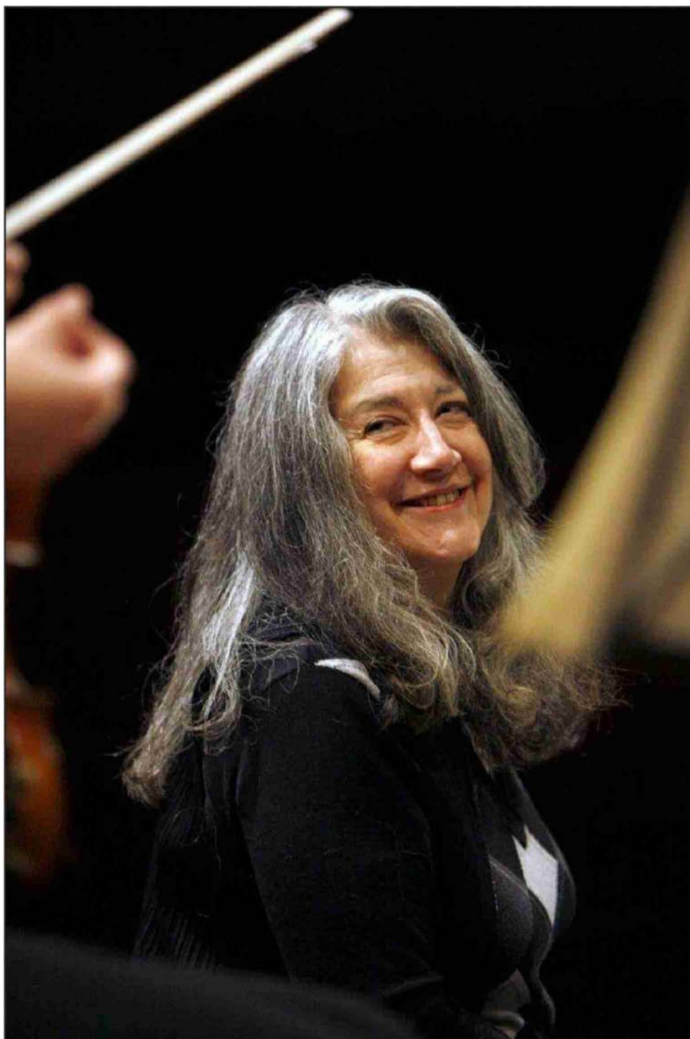
La grande Martha Argerich se voit dédier un documentaire par sa fille.

N° de thème: 832.63 N° d'abonnement: 1074342 Page: 35 Surface: 70'811 mm²